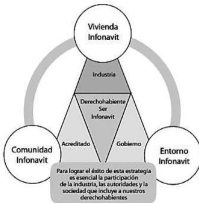
Cuadro 3. Diagrama de “Vivir INFONAVIT”

Este programa se encuentra integrado por tres dimensiones: comunidad, vivienda y entorno (ver cuadro 3).