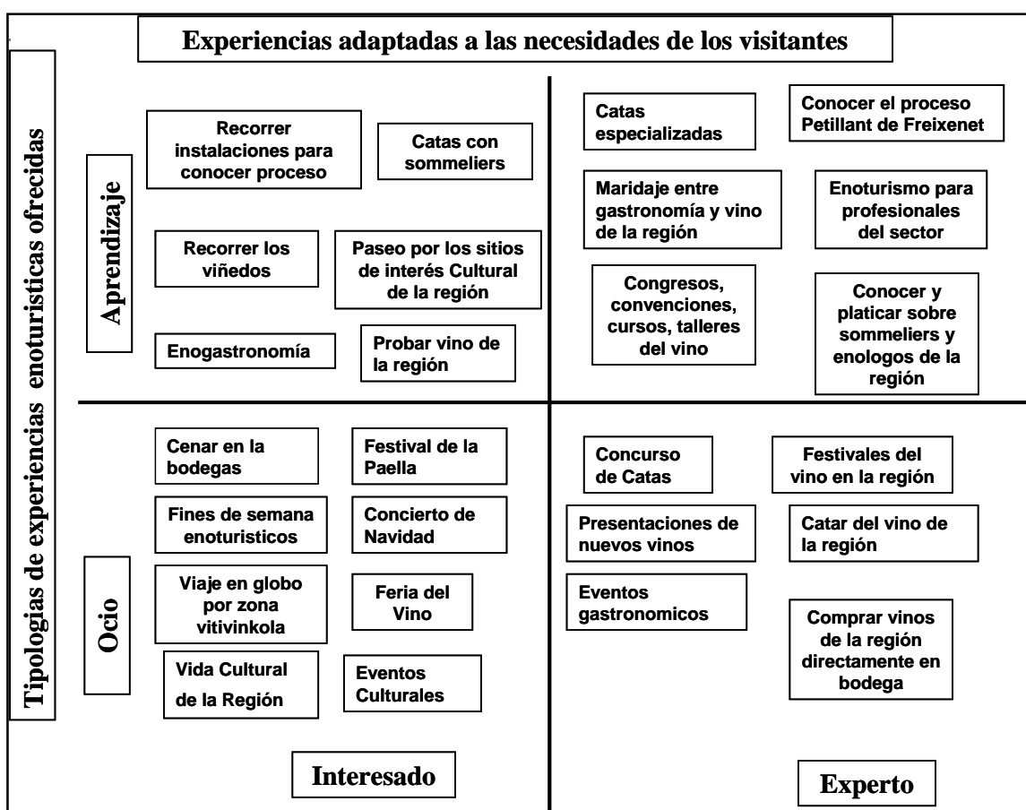
Figura 3: Experiencias adaptadas a las necesidades de los visitantes

El siguiente cuadro explica las distintas combinaciones de actividades que se pueden desarrollar sin alterar el entorno natural de la ruta, de acuerdo a las expectativas del enoturista.