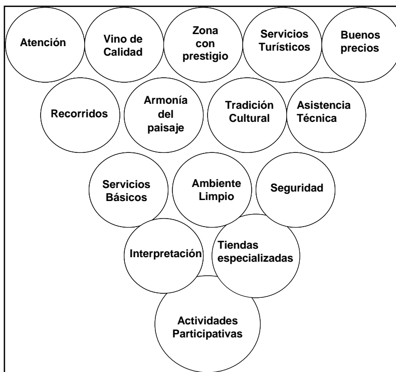
Figura 1: Elementos de la experiencia enoturístico de Pablo Szmulewicz