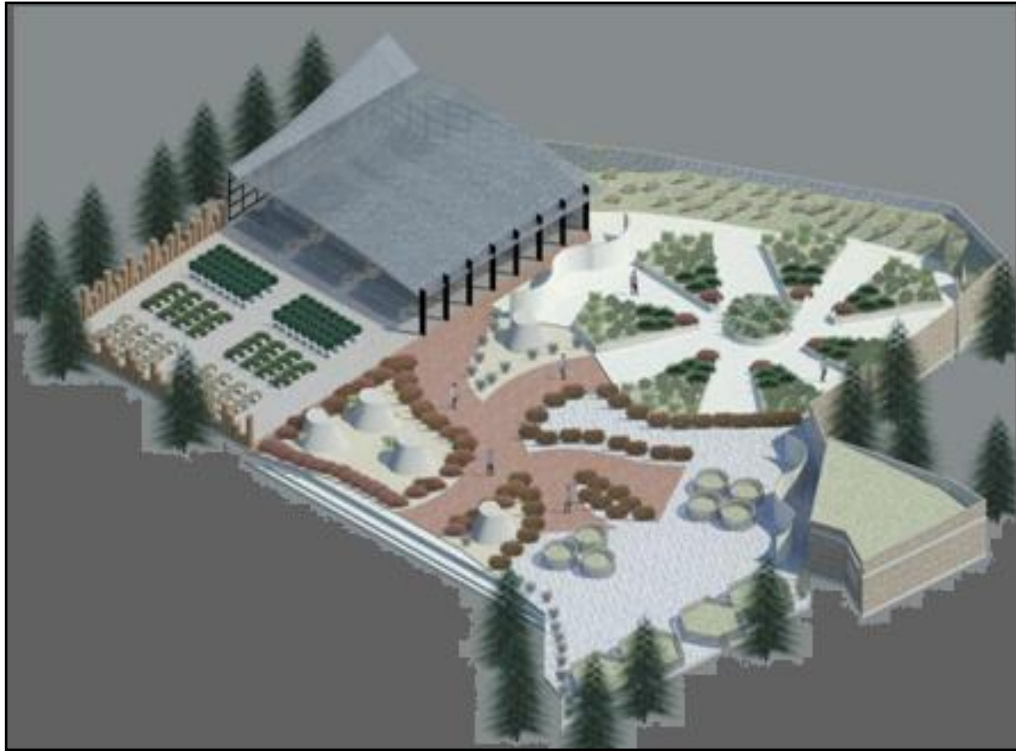
Figura 3. Área compostero-vivero-parcela demostrativa.

pretende tengan un lugar importante dentro del CEA como actividad educativo-recreativa y donde los niños puedan aprender jugando y teniendo un contacto directo con la naturaleza.