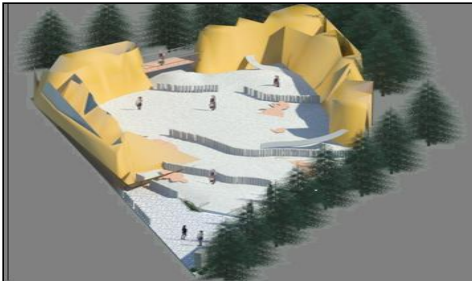
Figura 4. Área de fósiles.