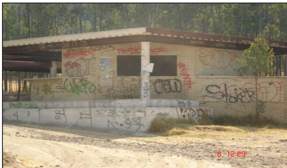
Figura 2. Infraestructura grafitada.

Otro de los supuestos que genera la propuesta es que durante la vida útil del edificio como FARO de Cautepéc, JN fue percibida como un espacio público visto exclusivamente como infraestructura física embellecida que no propició relaciones sociales interesantes para la población. Como lo muestra la figura 2, los grafitis son la respuesta de un segmento de la población a la carencia de valor de la infraestructura.