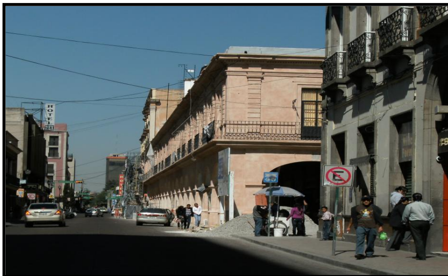
Figura 1. Fotografía de los portales, a en segundo plano se aprecia la degustación de los helados

helado, un elote, o bien simplemente contemplar la vida desde la tranquilidad y la frescura que aportaba la escasa pero efectiva naturaleza. Esto se aprecia en la Figura 1.