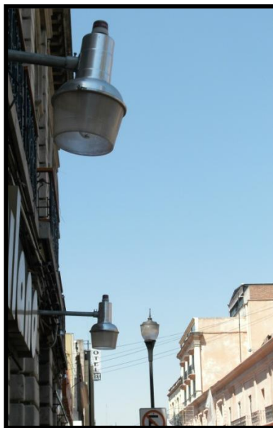
Figura 4. En esta imagen, se combinan los faros de dos diseños: modernos (en primer plano) y antiguos (segundo plano).