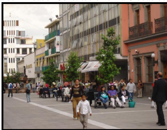
Figura 2. Fotografía del Andador Constitución en la Ciudad de Toluca

Hoy día, el habitante de Toluca al caminar sobre un amplio corredor, el cual se percibe visualmente una plancha de cemento rojo, donde lo único que se ocurre es cruzarlo rápido, pues no ofrece la cantidad suficiente para protegerse de los fuertes rayos solares, haciendo que la gente se apresure a llegar a su lugar de destino y salir lo más pronto del lugar, ya que no ofrece un rato de esparcimiento. (Ver Figura 2)