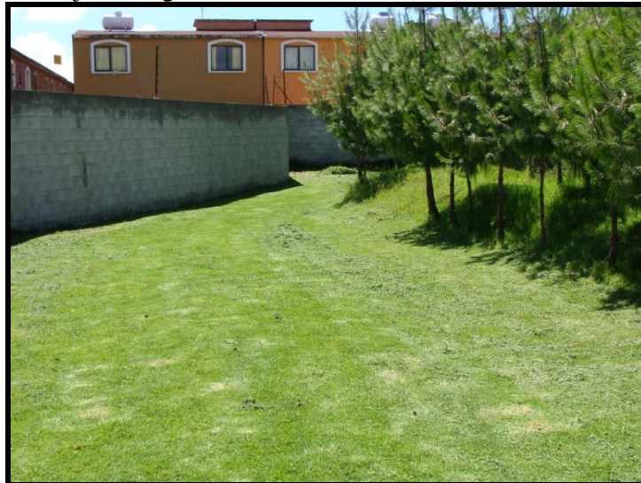
Figura 2. Mitigación del calor debido al efecto de “islas” (pavimento o edificios), en zonas urbanas mediante el manejo de vegetación